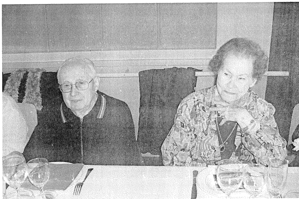
La doyenne et le doyen de l'assemblée.

Le 22 novembre 2008, le conseil municipal a réuni 85 ainés de notre village accompagnés de leurs conjoints ou conjointes dans la salle du foyer pour partager le repas annuel. Les artisans de notre village, boucherie MATH et boulangerie PAYEUR avaient préparé ce repas et le champagne était offert par l'usine HYDRO LEDUC. L'animation de cette belle journée a été assurée par les jeunes de notre village AZER'MUSIC. Ils ont su faire danser jeunes et moins jeunes. Un grand merci à tous nos ainés pour leur enthousiasme ainsi qu'à tous les bénévoles.